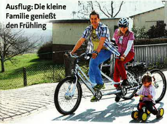
Ausflug: Die kleine Familie genießt den Frühling

■ Buch-Tipp: Miguel Almoril, „Gegen jede Prognose“, mvg Verlag, 17,99 Euro