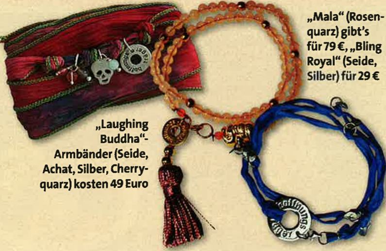
„Laughing Buddha“-Armbänder (Seide, Achat, Silber, Cherryquarz) kosten 49 Euro