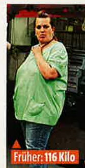
Früher: 116 Kilo