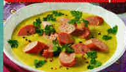
Kohlrabicreme mit Wurst