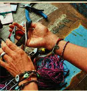
Wichtigste: Jedes Armband wird individuell in Handarbeit gefertigt

lan und verkauft sie an kleine Schweizer Ateliers. Das Hobby begleitet sie weiter, als sie Betriebswirtschaft studiert und ihre zwei Kinder (4 und 1) kriegt.